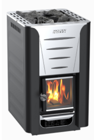
Holzofen 20 Pro