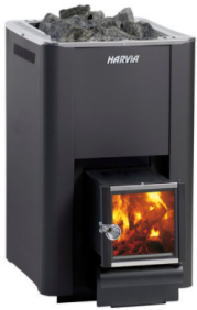
Holzofen Harvia 20 LS