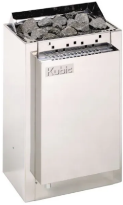
Kubic Combi 9 kW