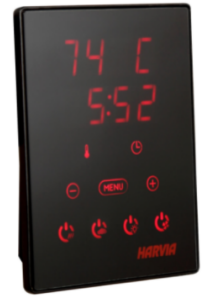
Xenio Combi CX110C