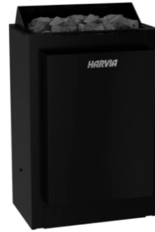
Combinator 8 kW mit Verdampfer