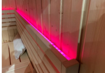
LED- Farblight Set für Fenix S2020S