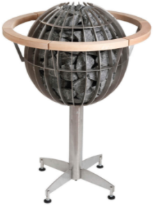
Schutzgeländer für Globe 110 E